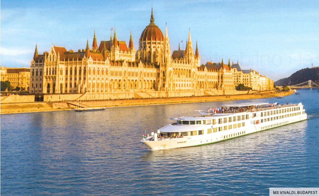
MS VIVALDI, BUDAPEST