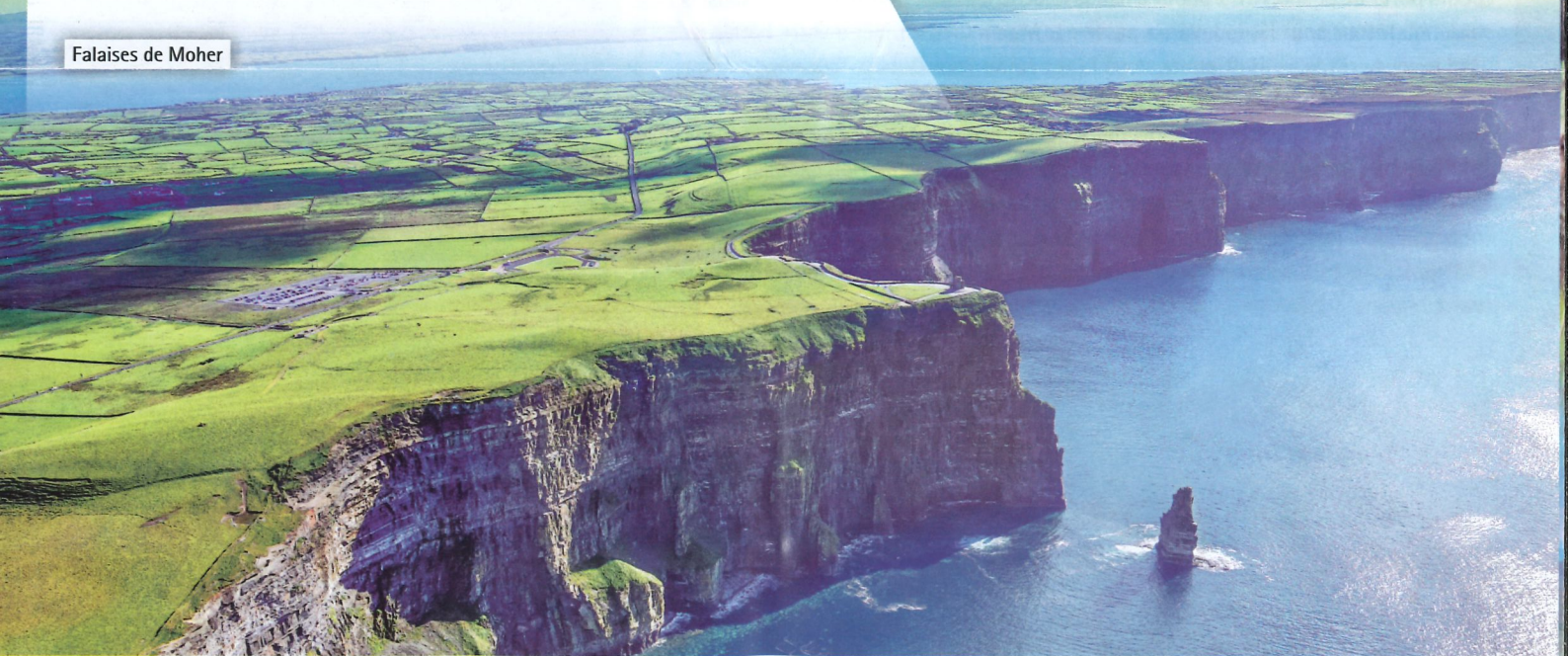
Falaises de Moher

Devise: Euro. Formalités: passeport ou carte d'identité. • Autres nationalités, consultez le consulat compétent. Participation minimale: 25 personnes. Documentation et photos non contractuelles. • Voyage soumis aux conditions générales de vente de M+K Voyages SA – Bâle.